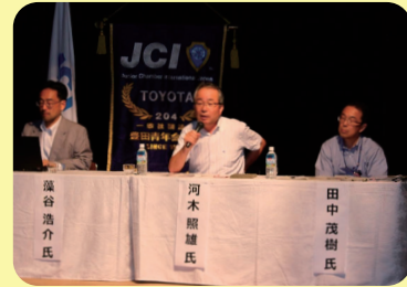
▲地域活性について様々な実績をあげる藻谷講師による講演。多くの学びがありました

地域活性セミナー ～地域愛による地域づくりを目指す～ 8月19日（金） 豊田産業文化センター 小ホール